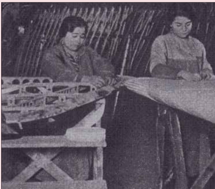
Trabajadoras de CASA en las labores de entelado, 1930

vieron que continuar con una labor para la que no habían sido preparadas: Hacer aviones.