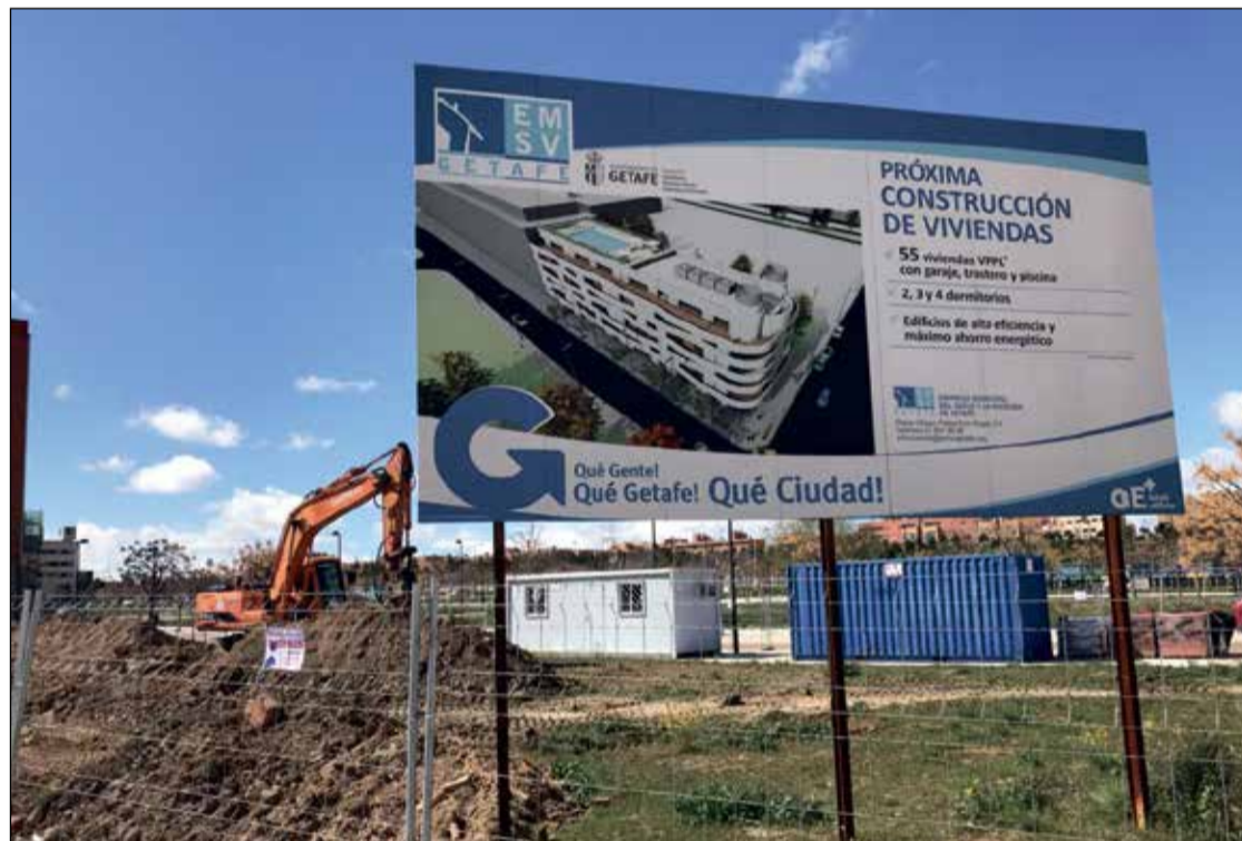
Página 8 Las máquinas ya trabajan en las parcelas donde se levantarán 147 viviendas públicas en El Rosón

◆ Finalmente llegó el día. La construcción de las dos promociones de vivienda pública gestionadas por la Empresa Municipal del Suelo y la Vivienda de Getafe (EMSV) en la zona de El Rosón arrancaron oficialmente el pasado 16 de marzo tras cerca de tres años de retraso y con los adjudicatarios en pie de guerra ante la incomprensible demora en el único gran proyecto urbano que gestiona el Gobierno local en la presente legislatura. Los futuros vecinos de estas 147 viviendas venían anunciando en las últimas fechas movilizaciones ante una situación enquistada desde que fueran adjudicadas en marzo de 2015. Desde entonces, se han topado con obstáculos en forma de irregularidades y renuncias que han dilatado mucho más el proyecto.